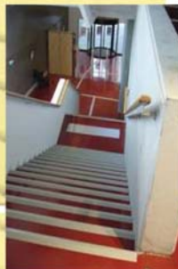
Sécurisation des escaliers