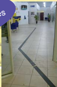
Guidage tactile au sol

Conception et installation de plan multisensoriels, s'adressant aux déficients visuels et personnes ayant des troubles intellectuels