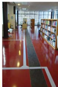
Structuration des espaces pour un usage partagé