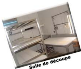
Salle de découpe